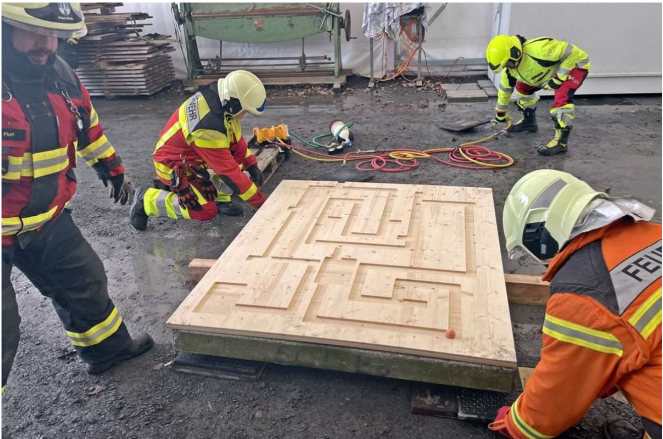
Erster gemeinsamer Kaderweiterbildungstag in Quarten